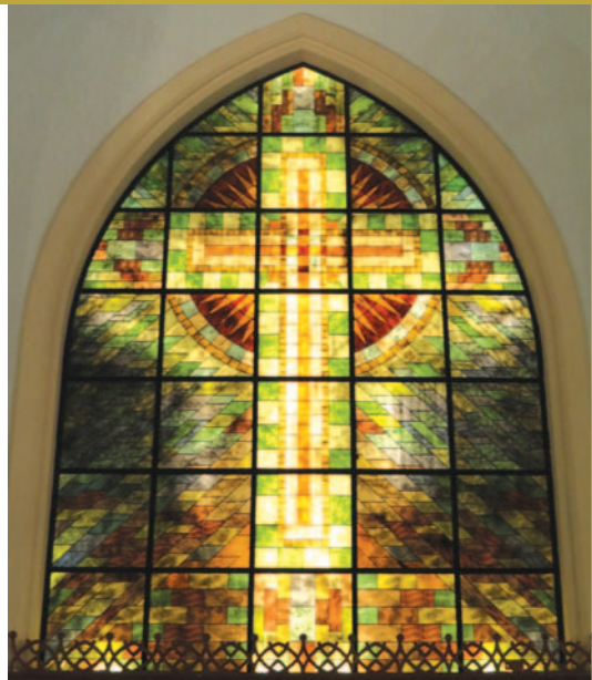
Մշուակողը՝ Կ. Եկեղեցիի վերանորոգումը պատկերող խաչը

Քանի մը տարի համալսարան, յետոյ կեանքի պայքար: Սեւն ու մոխրագոյնը միշտ պիտի ընկերանան ձեզի, սակայն ձեր ձեռքն է տխուր պաստառներուն վրան գունաւոր ծաղիկներ, սրտիկներ, ժպտիկներ եւ մանաւանդ խաչեր գծել, որովհետեւ գերագոյն սիրոյ նշանը խաչն է: