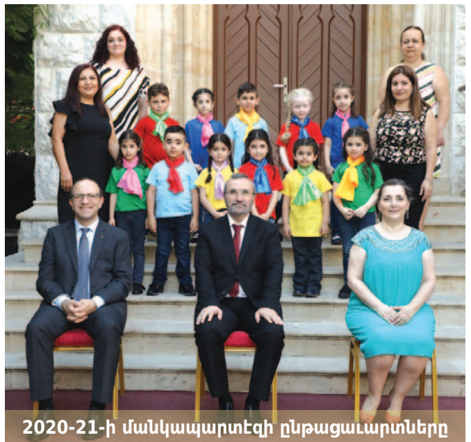
2020-21-ի մանկապարտեզի ընթացաւարտները