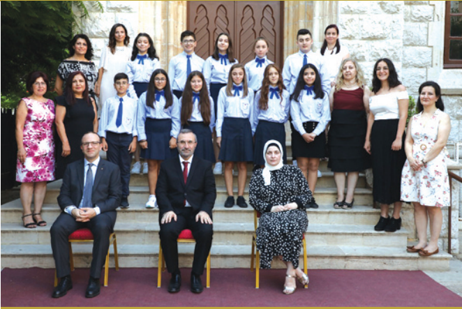
2019-20-ի նախակրթարանի ընթացաւարտները