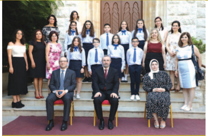
2020-21-ի նախակրթարանի ընթացաւարտները

Վերապատուելին կենդանի օրինակներով ներկայացուց իր զանազան առնչությունները ՀԱԳ-ին հետ, հրաւիրելով աշակերտները, որ իրեն պէս, իրենք ալ այստեղ գտնեն իրենց կեանքի տեսիլքը, ուղղութիւնը եւ կոչումը: