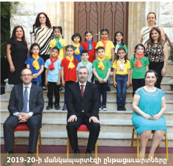
2019-20-ի մանկապարտեզի ընթացաւարտները