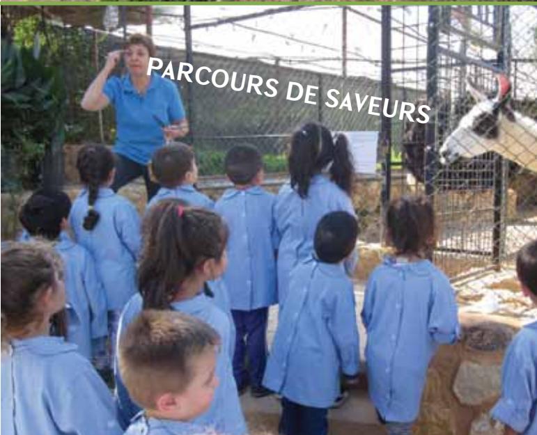
PARCOURS DE SAVEURS