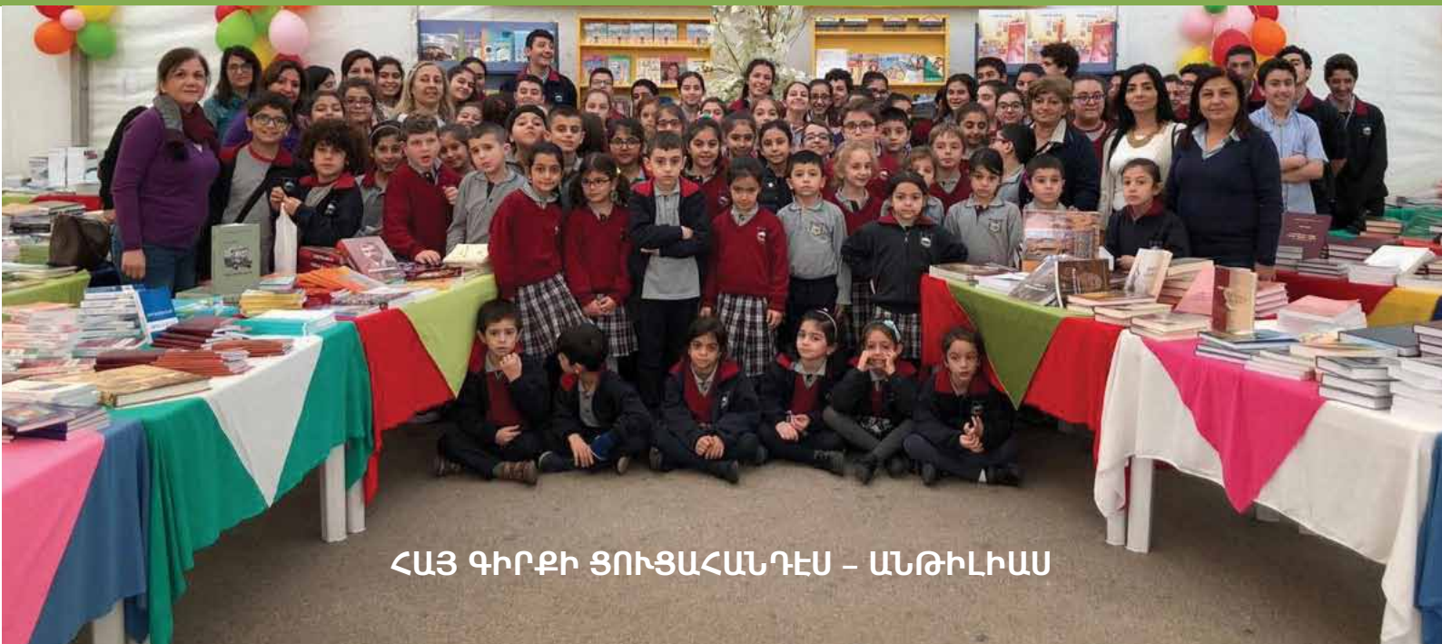
ՀԱՅ ԳԻՐՔԻ ՑՈՒՑԱՀԱՆԴԵՍ - ԱՆԹԻԼԻԱՍ