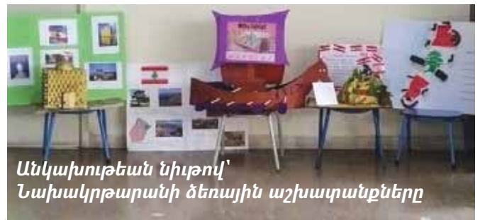
Անկախութեան նիւթով՝ Նախակրթարանի ձեռային աշխատանքները

Նոյն առիթով, Հայկազեան համալսարանի Ուսանողական գրասենեակը կազմակերպած էր նկարչական ցուցահանդէս մը, մասնակցութեամբ լիբանանեան դպրոցներու աշակերտներու: Մեր դպրոցի 10-րդ դասարանէն Եարա Եունէս եւ Այգ Արզումանեան եւս մասնակցեցան ցուցահանդէսին: